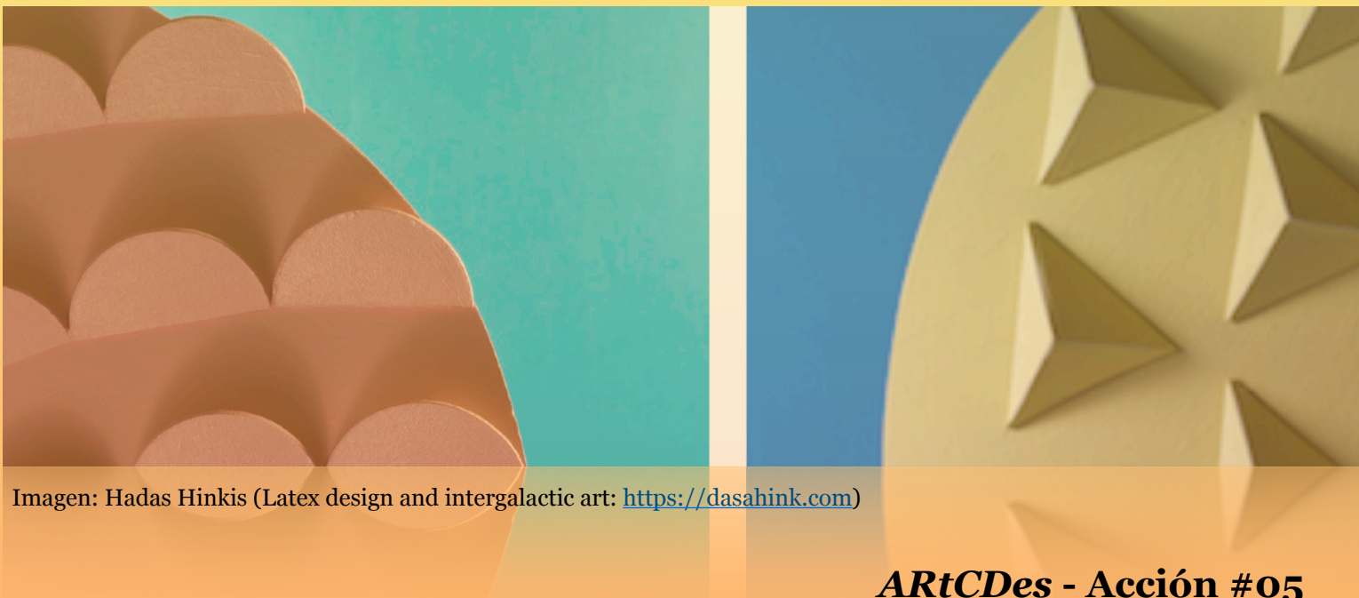
Imagen: Hadas Hinkis (Latex design and intergalactic art: https://dasahink.com )

https://juancantizzani.es/ambivalencias/