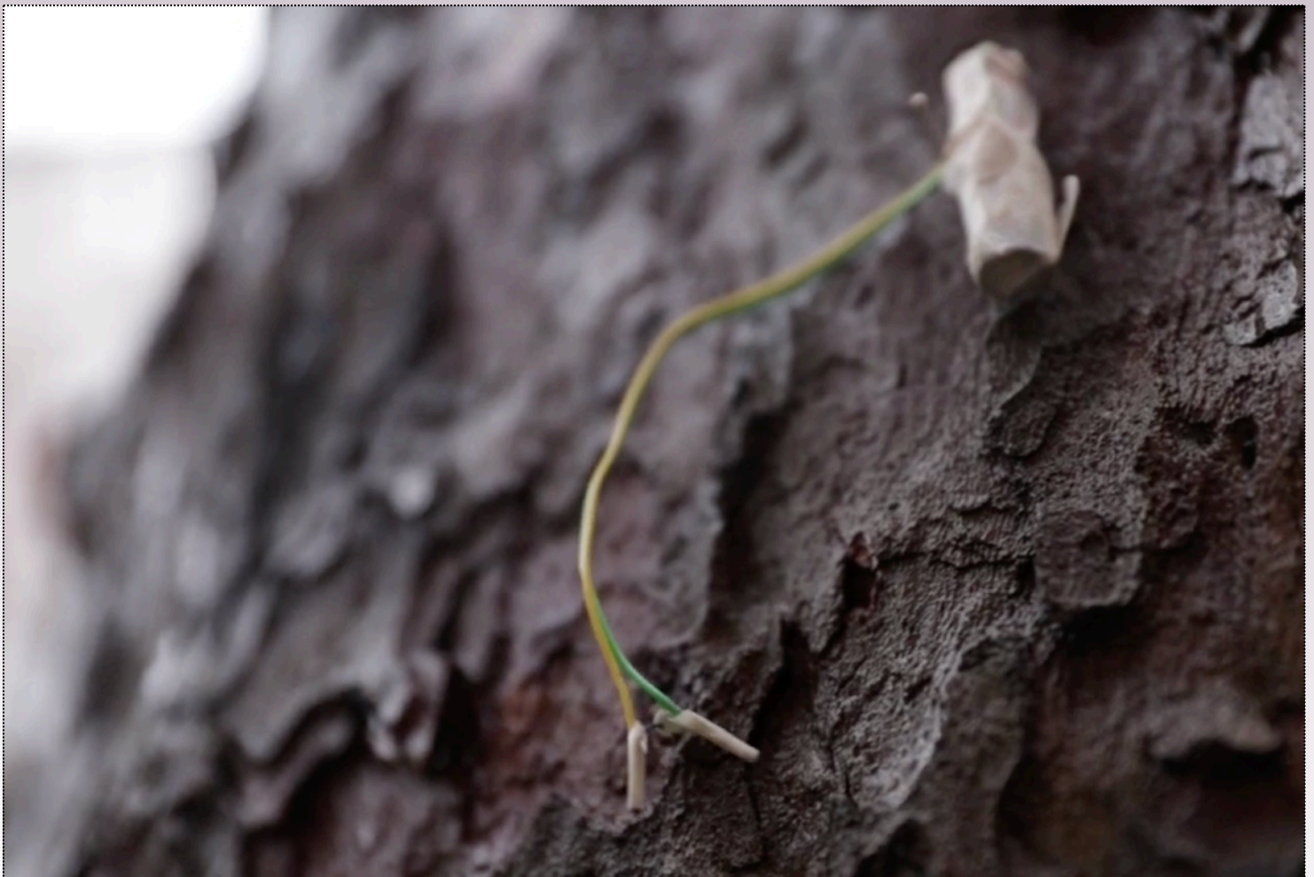
Detalle dispositivo actuando sobre la corteza de un árbol en espacio público.