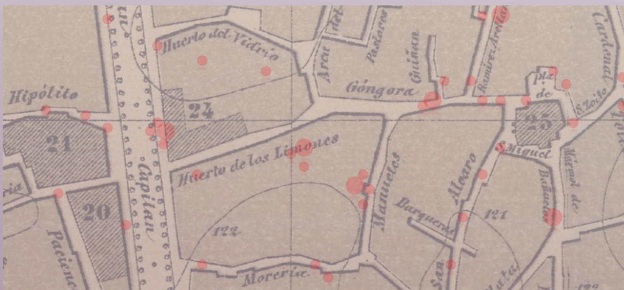
Localización aproximada-ubicación de los dispositivos.

#Activación #EspacioPúblico #SoundStreetArt #Vibración #Movimiento #Biodiversidad #Simbiosis