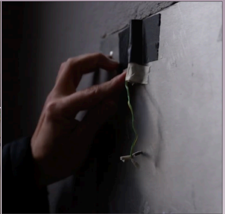
Detalle dispositivos (ensamblaje y pruebas)