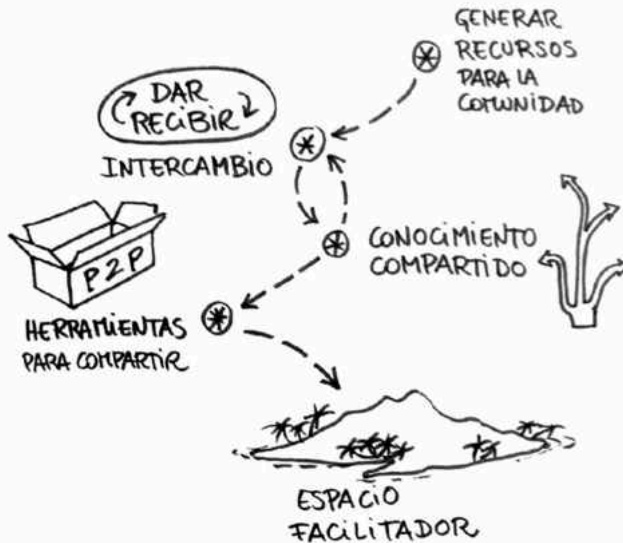
Imagen: Guía completa para colaborar - Ricardo Amasté